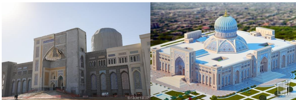
Внешний вид Центра исламской цивилизации. Архитектор: А. Турдиев

В последние годы в нашей стране уделяется внимание обновлению и оснащению музеев. Кроме того, в Узбекистане возводится здание Центра исламской цивилизации. В целях обеспечения реализации решения Президента Республики Узбекистан «О мерах по созданию Центра исламской цивилизации в Узбекистане при Кабинете Министров Республики Узбекистан» от 23 июня 2017 года № Постановляет построить центр. Соответственно, строительные работы Центра были начаты с левой стороны комплекса Хазрат-Имам в Ташкенте.